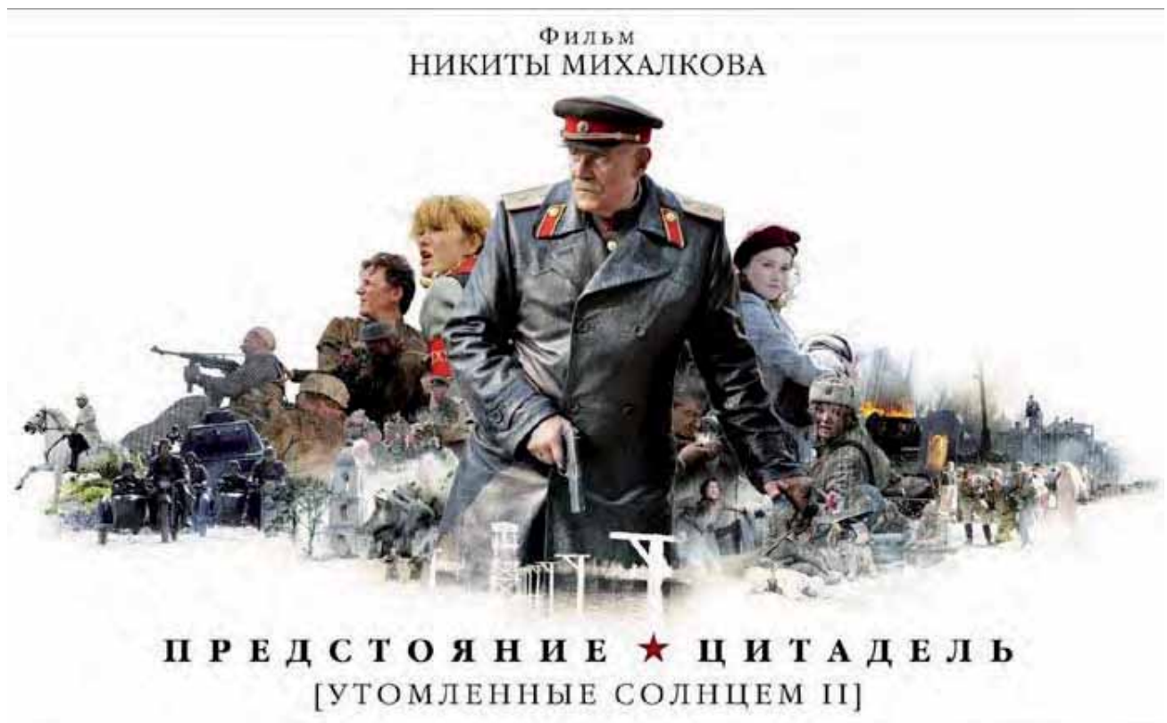
Cartel de la película Quemados por el sol

-Yo no puedo contestar por ellos, sería importante que filmaran sobre lo que quisieran, pero que supieran quién era Oblómov, por ejemplo. Creo que eso es lo principal. Existe una frase muy linda: la verdad cruel sin amor es una mentira. Estoy dispuesto a ver el