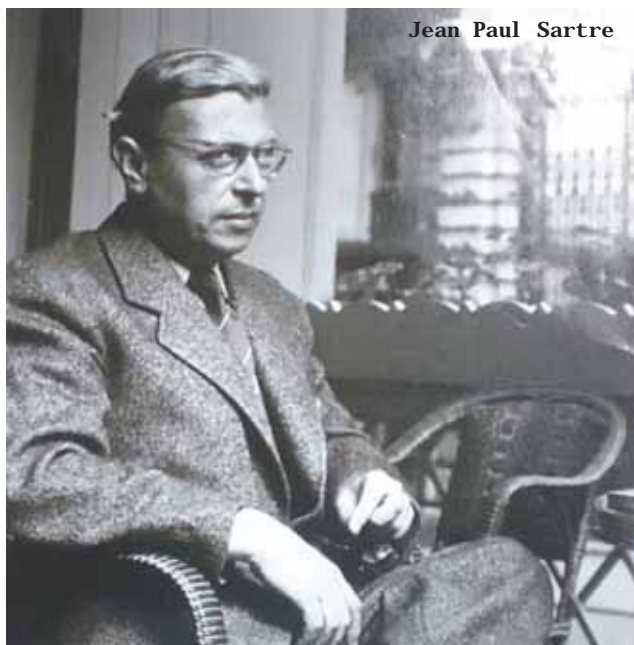
Jean Paul Sartre

24.- Para Nietzsche, el cristianismo representa un falso universo de ideales y de valores que en realidad deprime y aprisiona el sentimiento vital del hom-