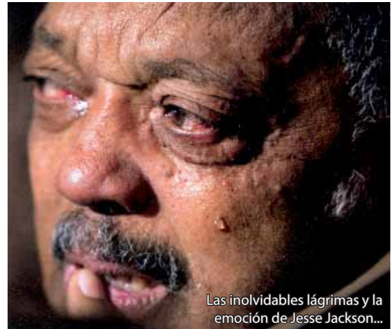
Las inolvidables lágrimas y la emoción de Jesse Jackson...

Luego llamó la atención que el apoyo que los esposos Clinton le brindaron después del reconocimiento de Hillary a su derrota, al finalizar las pre-candidaturas, no era solo una salida de cierre elegante a los durísimos ataques que le dirigieron la aspirante y senadora por New York y su marido William. Al contrarió, se abrió una nueva senda que trajo la incorporación de varios miembros del partido cercanos a los Clinton al equipo de gobierno, entre los cuales destaca el jefe de gabinete Rahm Ema-