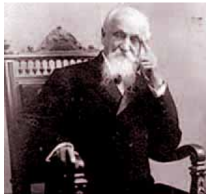
Salvador Cisneros Betancourt

acudía al liberalismo) entraba en franca contradicción con las vías prácticas de lograr la independencia y por tanto las transformaciones futuras. Despojar a la revolución de las normas postuladas en Guáimaro era quitarle el núcleo más progresista que traía la Guerra Grande. Lo dramático era que la democracia no podía existir en tal estado de sitio bélico. Por ello Manuel Sanguily planteó en carta a Vicente García: "Realicemos una brillante Constitución; formemos Senado, Cámara, elevemos a su más perfecta realidad, a la más completa verdad el sufragio universal, y todavía la república que brote de tal acuerdo será imaginaria, la libertad que emane de tan bello mecanismo, será ilusoria, mientras estén en Cuba