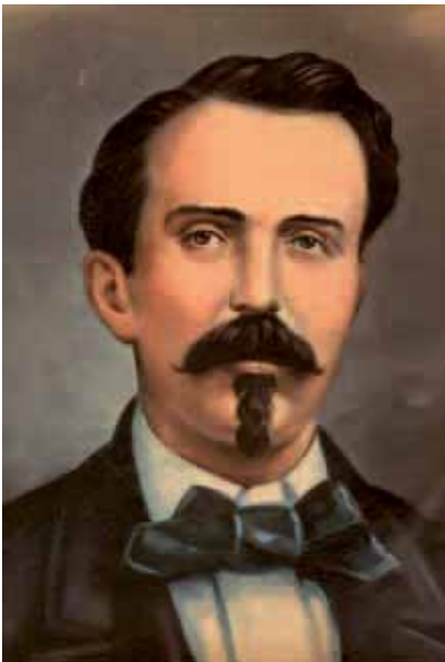
Carlos Manuel de Céspedes

García, extremadamente molesto, le envió una misiva a la Cámara de Representantes exponiendo varias quejas sobre la administración y esperaba tener respuestas. Estas nunca llegaron. Esta misiva llegó también a manos de los bayameses y manzanilleros por medio de enviados de García. Estos últimos en un acto de "solidaridad" comenzaron a mover el estado de opinión a favor de García. Para abril recibía el líder tunero respuestas escritas donde