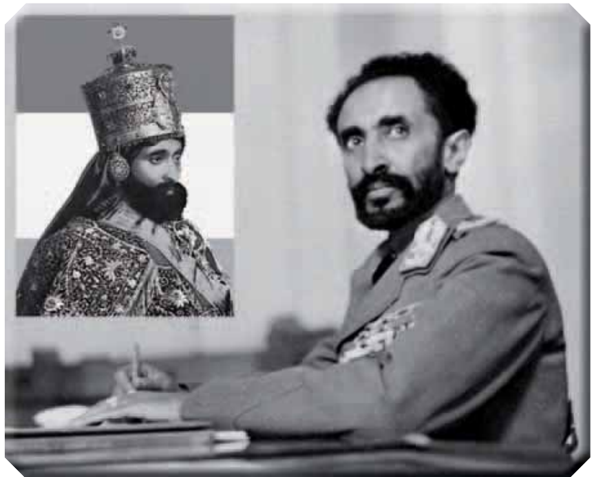
Ras Makonnen Haile Selassie I Ras Tafari (“cabeza de la creación” o “cabeza creadora” en amárico).

En el año en que Haile Selassie llegó al trono, en Jamaica (en ese entonces aún colonia británica) los prejuicios