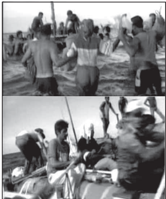
Agosto de 1994. Éxodo masivo hacia Estados Unidos.

Pero también se hará forzoso desencadenar un proceso nacional de recuperación de la memoria histórica, con el propósito de facilitar la apropiación de la experiencia nacional, así como los referentes que ofrece el quehacer fundante de varias generaciones de cubanos.