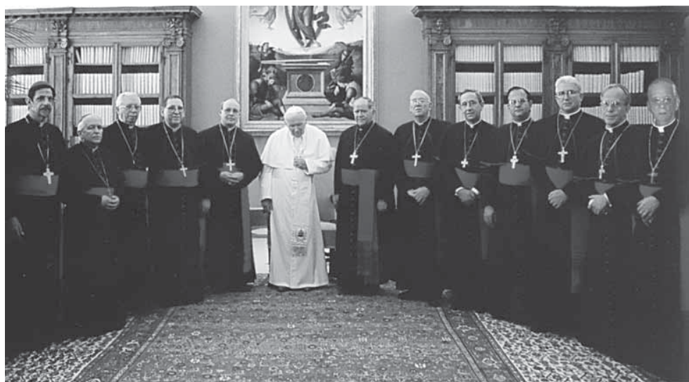
Obispos cubanos que suscribieron la Carta Pastoral El amor todo lo espera , junto al papa Juan Pablo II.