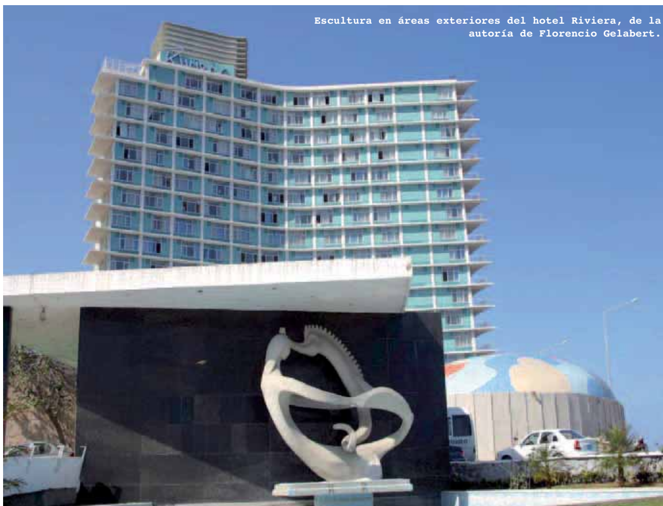
Escultura en áreas exteriores del hotel Riviera, de la autoría de Florencio Gelabert.

específica, forjada en el propio devenir y unida a la personalidad, que actúa a partir de la responsabilidad, el rigor y la voluntad, en la medida que nuestros mejores criterios permitan avanzar en la obra. De donde se concluyen, al menos tres aspectos medulares.