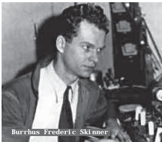
Burrhus Frederic Skinner

Desde el siglo XVIII muchos antropólogos en Norteamérica comenzaron a interesarse en el estudio de las culturas indígenas, ya que estas preservan ricas experiencias sobre la sobrevivencia, adaptación y convivencia del ser humano en los más diversos medios geográficos de este inmenso continente.