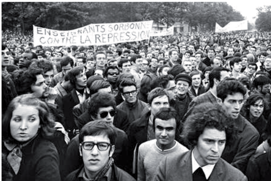
Multitudinaria marcha de protesta. El letrero dice: Maestros de La Sorbona contra la represión (mayo 10, 1968).

distinto. De una manera más o menos consciente, esta demanda de los pobres cuestiona la ciudad terrestre a nombre del Reino prometido para el final de los tiempos; ella nos obliga, a nosotros, los hombres, a perfeccionar sin cesar nuestra sociedad, a hacer de ella un bosquejo nunca terminado del Reino de Dios.”