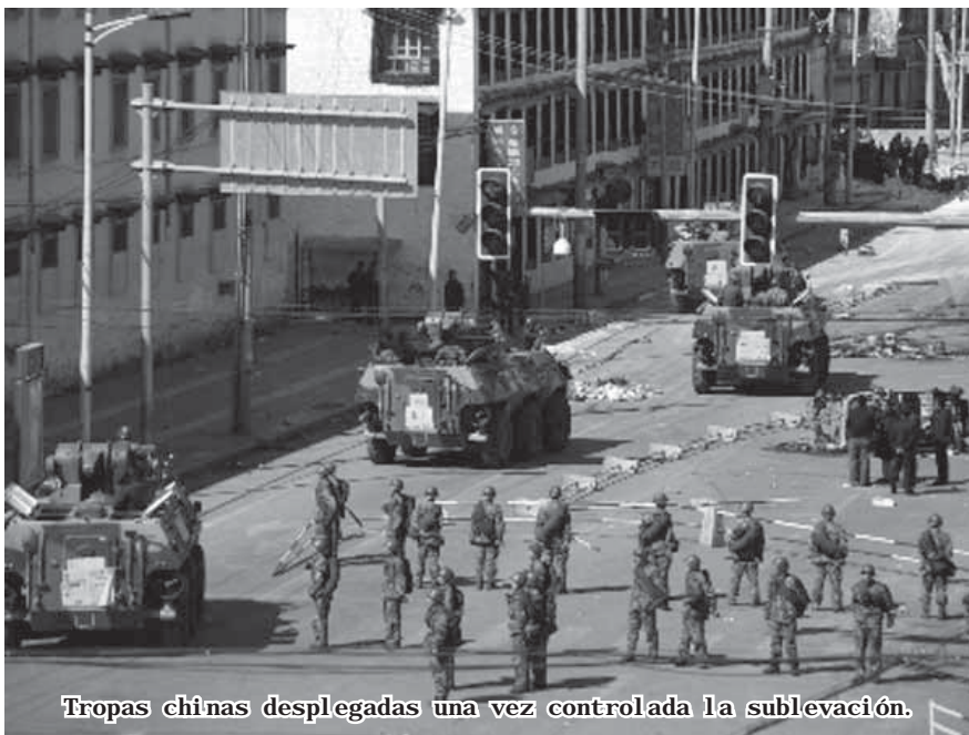
Tropas chinas desplegadas una vez controlada la sublevación.

Desde allí el líder espiritual de los budistas tibetanos ha timoneado sus relaciones con el gobierno de Beijing. Otras decenas de miles viven exiliados por el mundo, sobre todo en Estados Unidos.