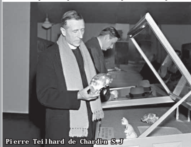
Pierre Teilhard de Chardin S.J

17. Ya en el siglo XVIII, incluiría entre los intelectuales al más notable músico cubano de la época, el padre Esteban Salas (1725–1803). Nacido en La Habana, se desempeñó como sacerdote en Santiago de Cuba, desde 1764 hasta su muerte. Allí fue Profesor de Teología Moral –ministerio que no se suele mencionar cuando se habla de él– en el Seminario San Basilio Magno, el más importante centro cultural de la ciudad, y Maestro de Capilla de la Catedral. Para ella compuso una gran cantidad de buena música religiosa, tanto “culto”, para la liturgia y las paraliturgias, como “popular” (villancicos). Es un caso excepcional que un hombre que nunca viajó fuera