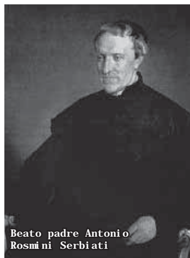
Beato padre Antonio Rosmini Serbiati

la expresión, lingüística o de otro medio de comunicación, de los contenidos de la Fe, en aras de la evangelización integral. En el caso de que proceda “de manera espontánea”, a partir de su conciencia, no por encargo de la autoridad eclesiástica, el intelectual católico sabe que, si es católico de veras, su saber y su proceder deben ir siempre en la línea de la comunión eclesial, tal y como la entiende la Iglesia Católica, jerárquicamente organizada por voluntad del Señor. Un católico que lo sea de veras, intelectual o no, sabe que los francotiradores y los asteroides erráticos, no participan totalmente de la comunión eclesial.