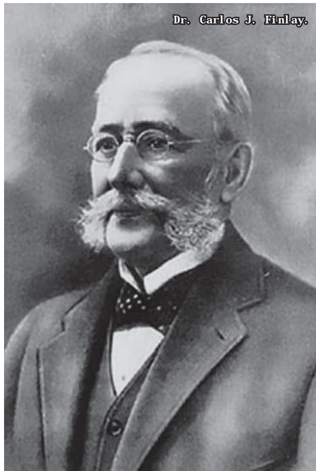
Dr. Carlos J. Finlay.

mera etapa, anoto, en primer lugar, a Fr. Bartolomé de las Casas, op (1474-1516), sevillano, que llegó a Cuba como colonizador y encomendero. Después de su “conversión”, dejó las “encomiendas” y tomó el camino de la vida sacerdotal, en la orden de Santo Domingo. Recibió su formación intelectual, primero, en Santo Domingo, y luego, en España y en Roma. Llegó a adquirir una sólida cultura, en materias que hoy, más que como teología a secas, calificaría como “antropología teológica”. Supo y pudo integrar su vocación sacerdotal y religiosa, con sus conocimientos, con los diálogos y disputas –de carácter filosófico- teológico-académico y jurídico– acerca de la condición de los indios americanos, con su acción sociopolítica a favor de esa misma población aborigen de América y, excepcionalmente, durante pocos años, con el ministerio episcopal.