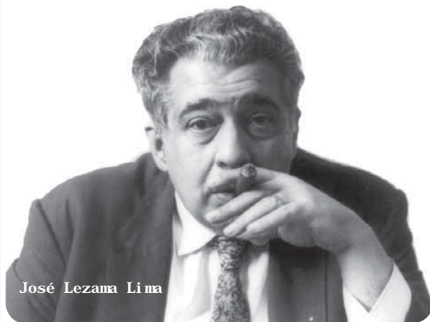
José Lezama Lima

asalariados a su servicio y bajo esa condición aceptó, por ejemplo, al notable historiador Ramiro Guerra como Secretario de la Presidencia y a Antonio Sánchez de Bustamante y Sirvén, el más importante jurista internacional que ha dado nuestro país, para que en 1928 le otorgara visos de legalidad a la arbitraria prórroga de poderes. En ambos casos eran prestigiosos intelectuales que lastimosamente ponían su talento en función de una causa innoble. Como contraparte podemos mencionar al poeta Agustín Acosta, quien en junio de 1931 le envió a Machado una carta pública en la cual condenaba sus desmanes. Como pago a su gesto cívico fue confinado en un calabozo de la Fortaleza de La Cabaña.