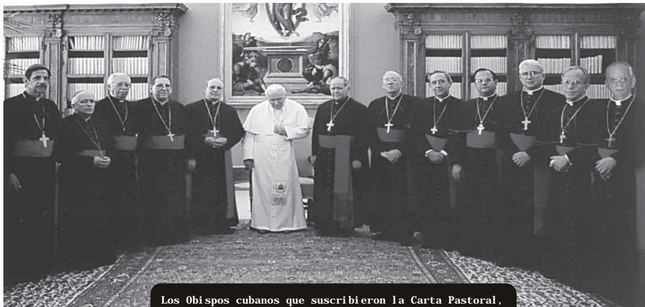
Los Obispos cubanos que suscribieron la Carta Pastoral, junto al papa Juan Pablo II.

“La fe cristiana, que no es una ideología en sí misma, puede vivirse en cualquier sistema político o proceso histórico sin identificarse necesaria y totalmente con ninguno de ellos.” (DF, 419) mientras que en El amor todo lo espera los obispos precisaban que no se identificaban “(...) con ningún partido, agrupación política o ideología, porque la fe no es una ideología, aunque éstas