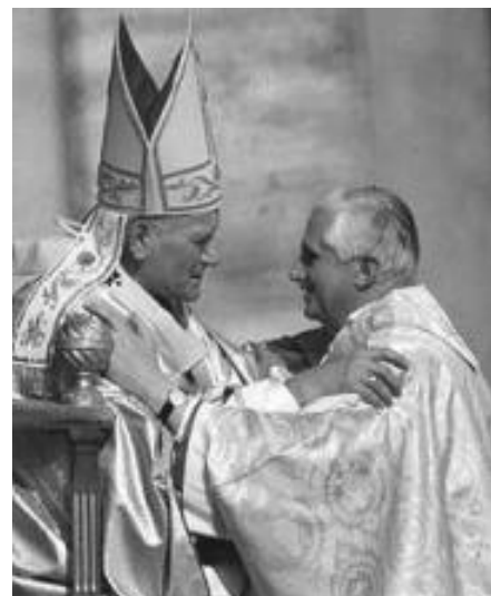
SS Juan Pablo II saludando al actual papa Benedicto XVI

La defensa de los derechos de la persona es señalada y mantenida sobre todo en el caso de los refugiados, que constituyen "de todas las tragedias humanas de nuestro tiempo, tal vez la más grande" (21.3.1981); los refugiados exigen una especial atención y solidaridad por parte de la comunidad internacional y de los países ricos, pues se encuentran en una situación no de emergencia, "sino de verdadera exclusión forzosa, que les hiera en sus sentimientos más profundos y que con frecuencia equivale a una muerte civil " (16.1.1982). El mismo problema de los trabajadores ilegales y clandestinos está adquiriendo una prioridad también por parte de las iniciativas de la Iglesia, a la búsqueda de medios adecuados, tanto de carácter asistencial como jurídico-normativo, para eliminar el estatuto de clandestinidad y las consecuencias negativas que de él se derivan. La Iglesia desea contribuir al desarrollo y a la amplitud de miras de las orientaciones gubernamentales en el campo de la emigración, haciéndose portavoz de las personas más desfavorecidas y marginadas.