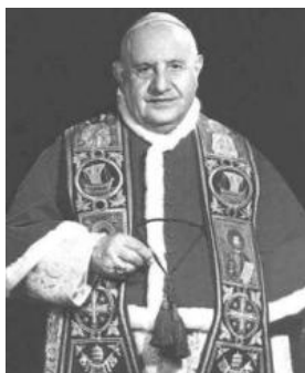
SS Juan XXIII

El fenómeno migratorio, en tanto que movimiento de masas de trabajadores de un país a otro a consecuencia del proceso de industrialización, cogió un poco por sorpresa a la Iglesia, anclada en estructuras de tipo territorial.