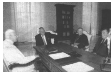
Benedicto XVI en audiencia con el Comité Judío Internacional para consultas interreligiosas.